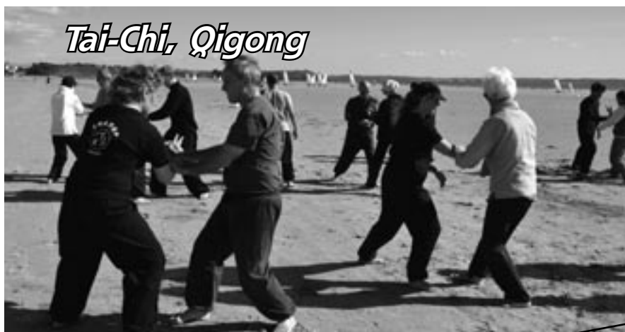
Plage de Pentrez, Saint Nic - 29127 Plomodiern

Fiche à retourner à : Académie Pascal Plée 34, rue de la Montagne Ste Geneviève - 75005 Paris Tél. : (33) 01 43 25 57 42 Site : www.pascal-plee.com Mail : pascalplee@free.fr