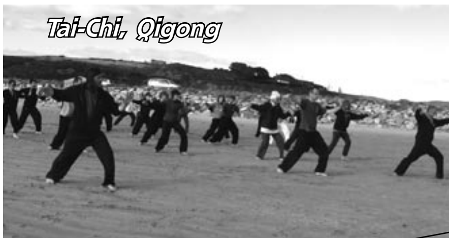
Plage de Pentrez, Saint Nic - 29127 Plomodiern